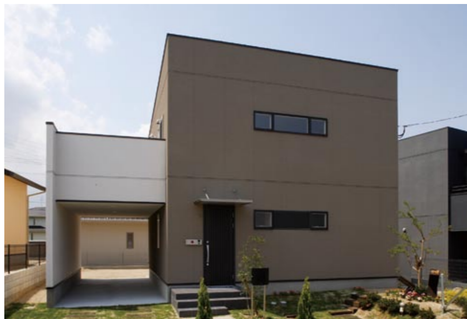
車好きにはうれしい愛車を守るインナーガレージが提案された、23号地モデルハウス。落ち着いた配色、キューブスタイルのシンプルな外観のファサード面には横長の窓を配置した、同社が得意とするモダンデザインの家