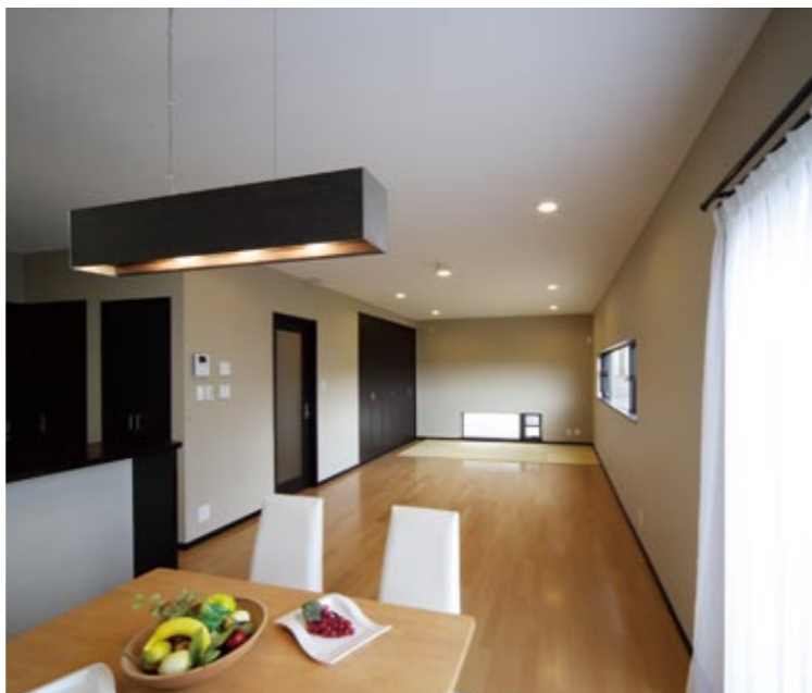
大容量の収納も確保した24.5畳の広いリビング。低い位置に設けた窓は座る視線も考え配置されており、庭を眺められる設計。置き畳で和の空間としての利用を提案している