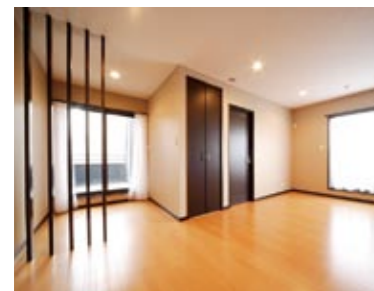
2つのバルコニーに面し、開放感のある主寝室。面格子の奥に書斎コーナーなどに利用したい