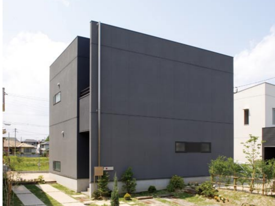
建物前面に窓が一つだけの外観は、ぜひ内部を見てみたくなる斬新なデザイン。壁の向こうに玄関があり、通りからの視線を遮るため、住む人のプライバシーに配慮した設計提案のひとつ。(写真は全て「ハミングタウン上の原」で撮影)