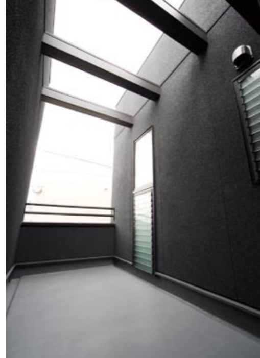
右写真の2階部分は一部プライベートバルコニーになっており、使い方を考えるのも楽しい