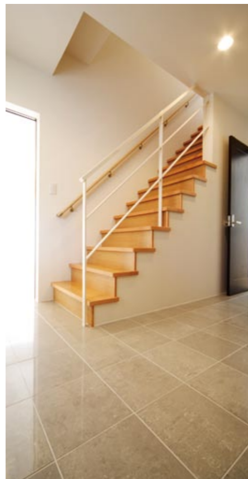
玄関ホールは大理石を使い、上質な雰囲気。シンプルな階段の手すりが開放感を確保