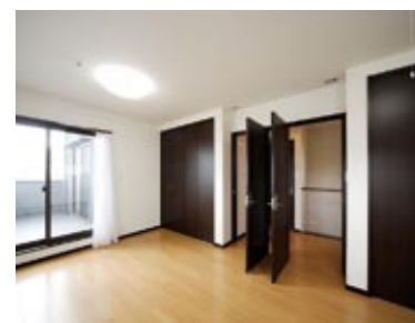
子どもの成長に合わせ、間仕切りすることも可能な2ドア1ルームのプランニング