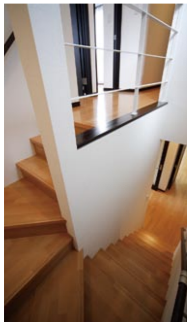
普通なら壁にしてしまいたいような場所も遊び心のあるデザインで暮らしを愉しむ提案がいっぱい