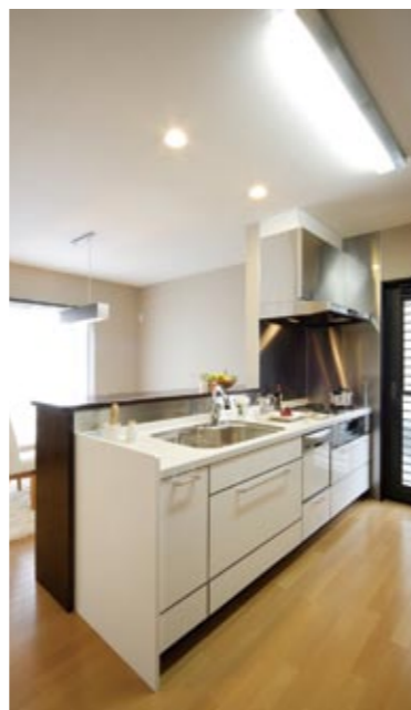
家族とのコミュニケーションをしながら料理ができる、対面式カウンターキッチン