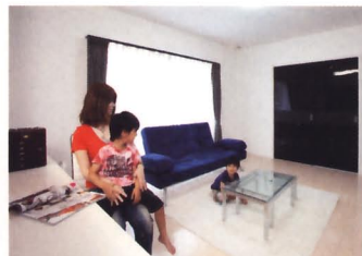
選んだ黒い建具に合わせ、リビングの床やクロスもモノトーンでコーディネート