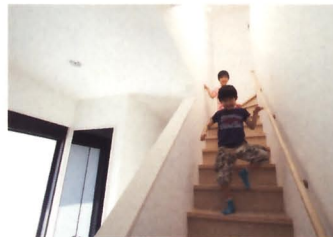
元気いっぱいのおふたりのお子さんにとって、広くなった住まいは絶好の遊び場