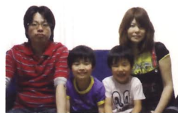
希望通りのカッコいい家が完成。決断して良かったというHさん