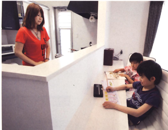
家事をしながら子どもたちの勉強を見守ることができるようにと、希望したカウンター。雑然としがちなキッチンが見えない高さにしたのも、家づくりの参考にしたいポイント