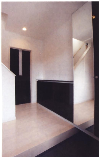
H邸の建具やユニット家具は全て鏡面仕上げ。モノトーンで統一したお洒落な空間だ