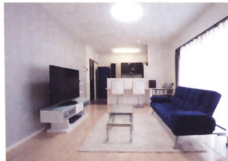
個性的なクロスを選びアクセントとしたH邸。リビングは細かな模様のグレーを1面に採用